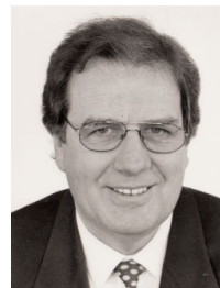
Seminarleiter: Prof. Dr. Friedrich-Wilhelm Bach, Universität Hannover

Im vorliegenden Seminar werden industriell eingesetzte Beschichtungsverfahren aus den Bereichen des Auftragschweißens und -lötens, des Plasma-, Lichtbogen- und Flamm-spritzens, der Sol-Gel-Technik sowie der Dünnschichttechnologien, Chemical Vapour-Deposition (CVD) und Physical Vapour-Deposition (PVD), vorgestellt. Besondere Bedeutung wird dabei der Verbindung von Prozess- und Werkstofftechnologie im Hinblick auf das Herstellen anforderungsgerechter Schichten beigemessen. Praktische Vorführungen an den Beschichtungsanlagen und Workshops zu speziellen Themen der behandelten Beschichtungsverfahren ergänzen die Seminarvorträge.