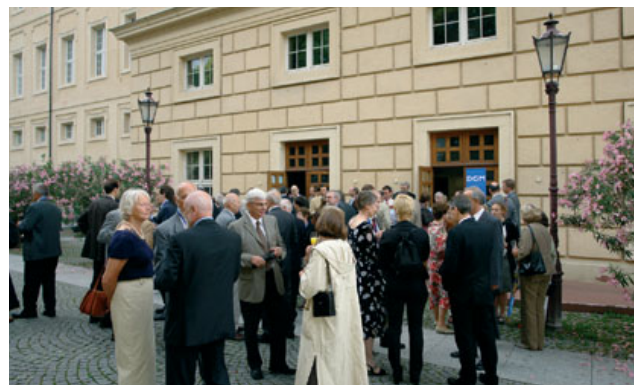
Der Gesellschaftsabend fand im Durlacher Schloss statt, vor dem man sich zum Aperitif traf.